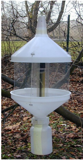
صورة رقم ٢ مصيدة ضوئية